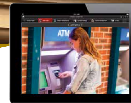
iVMS-5260HD Mobiler Client